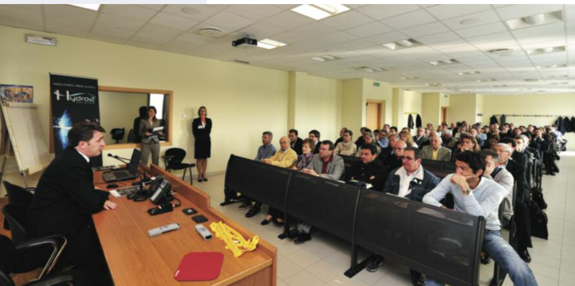
Aula didattica di formazione ISFAI

L'Istituto Clinico Universitario si caratterizza anche per la presenza di un'ala interamente dedicata all'attività didattica. Presso tale sede infatti si trova I.S.F.A.I. (Istituto Superiore di Formazione per Aziende e Imprese). Nato nel 2009 dalla volontà del Gruppo Sanitario Policlinico di Monza per svolgere attività di formazione in ambito sanitario e di salute e sicurezza sui luoghi di lavoro, I.S.F.A.I. è un ente formativo accreditato presso Regione Lombardia e Regione Piemonte ed è in grado di erogare formazione per ogni tipo di azienda e impresa e crediti ECM (Educazione Continua in Medicina), sia in ambito regionale sia nazionale, in base alla normativa vigente. Un importante strumento di crescita per tutto il personale del Gruppo Sanitario Policlinico di Monza e non solo. A disposizione di docenti e discenti 5 aule didattiche, un'aula magna da 99 posti e un campus dotato di 14 stanze.