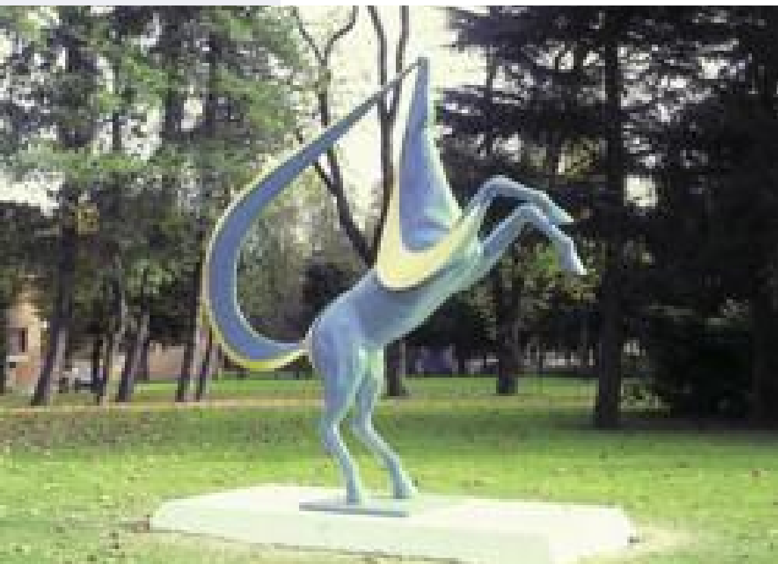
Cavallo: opera dello scultore Ottaviani

Il Direttore Sanitario può, in alcuni casi, svolgere le funzioni di ufficiale di stato civile (es. nelle autentiche di sottoscrizione di firma per i pazienti ricoverati). Egli è responsabile della conservazione, della tenuta e del rilascio di fotocopie di cartelle cliniche, secondo le modalità stabilite.