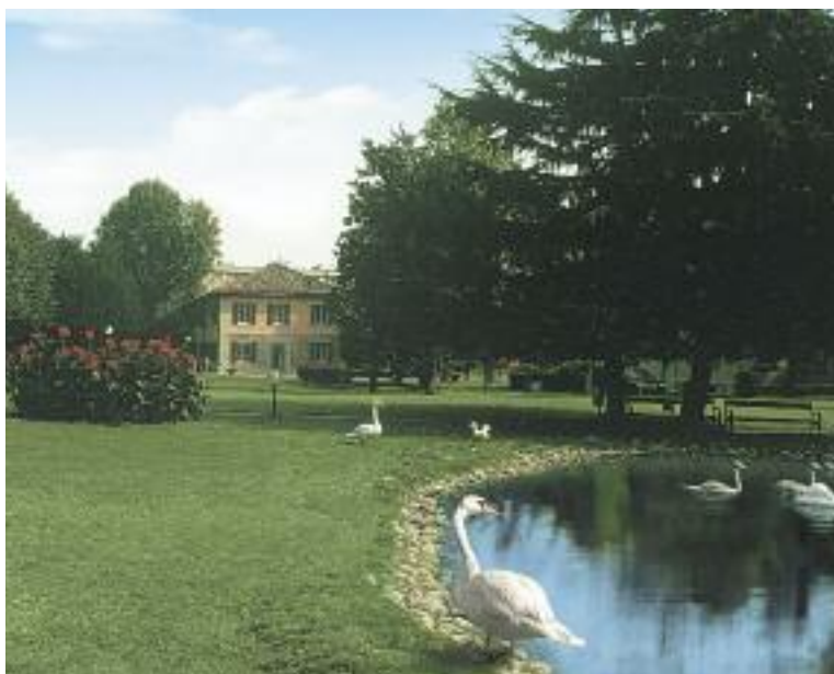
Policlinico di Monza, via Amati 111 – Monza

Da qui l'idea su cui si fonda l'Ambulatorio di educazione del paziente diabetico ovvero quella di far sì che la persona affetta dalla patologia non si senta mai sola, ma trovi nel personale medico, e soprattutto in quello infermieristico, un interlocutore che possa essergli d'aiuto a superare le perplessità e i dubbi sulla modalità di assunzione della terapia e su tutti gli altri aspetti della malattia.