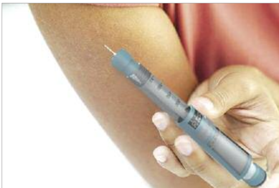
Penna per la somministrazione di insulina

Per raggiungere il tessuto adiposo la tecnica comunemente utilizzata è di fare una pli-