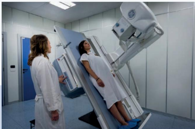
Diagnóstico por imágenes