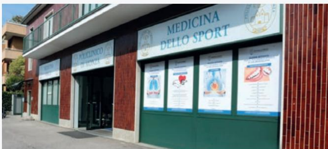
Entrada a la clínica