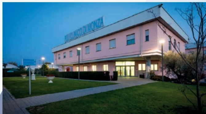
Entrada a la estructura