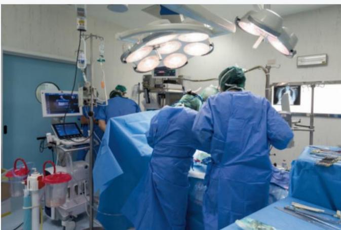
Sala de operaciones