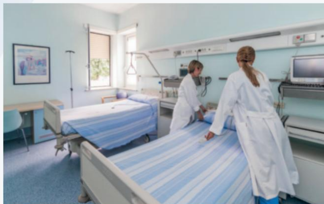
Habitaciones de hospital