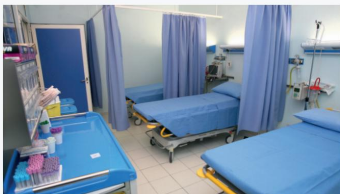
Sala de emergencia

El Departamento de Emergencias es responsable de garantizar los servicios, terapias diagnósticas necesarias para apoyar funciones vitales, movilización traumática, recuperación y el mantenimiento de funciones vitales incluso con intervenciones invasivas si lo permite el nivel organizacional de guarnición.