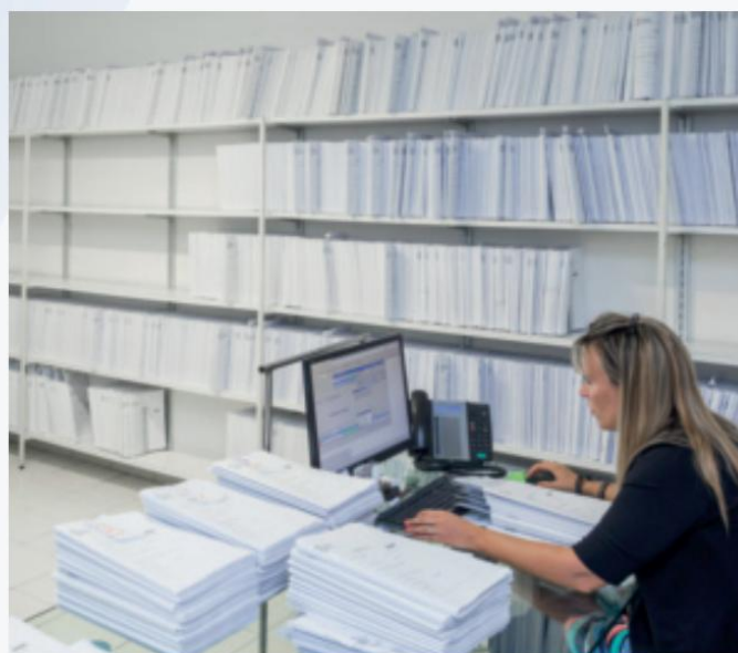
oficina de registros médicos