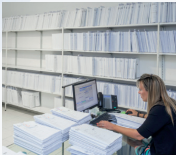
Ufficio cartelle cliniche