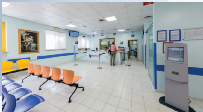
CUP (Centro Unico Prenotazioni)