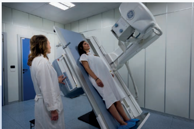
Diagnostica per immagini

Oculistica Centro di Ricerca di Posturologia Endocrinologia e Medicina Metabolica