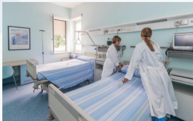
Camere di degenza